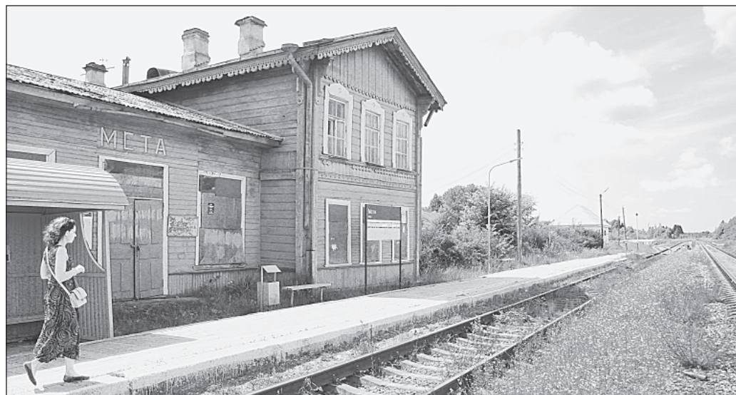
Здесь ещё ходят поезда...

Наталья ЧУРА.