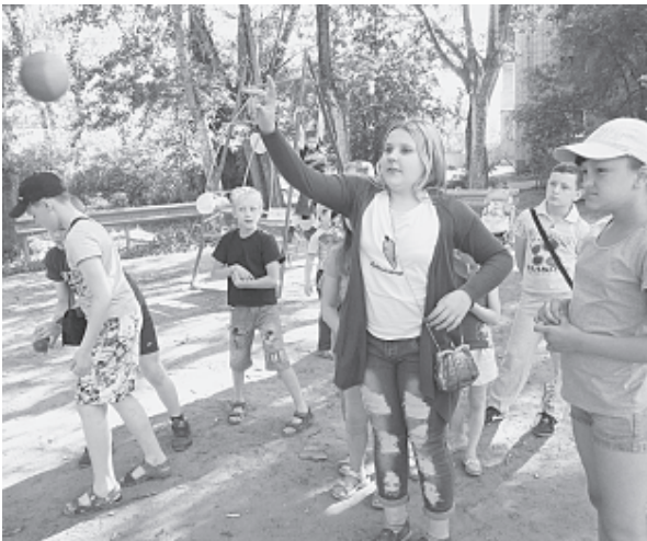
Любимая игра — броски мяча в корзину