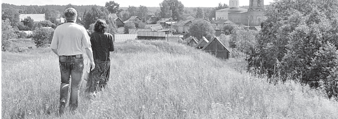
На холме в Берёзовском Рядке