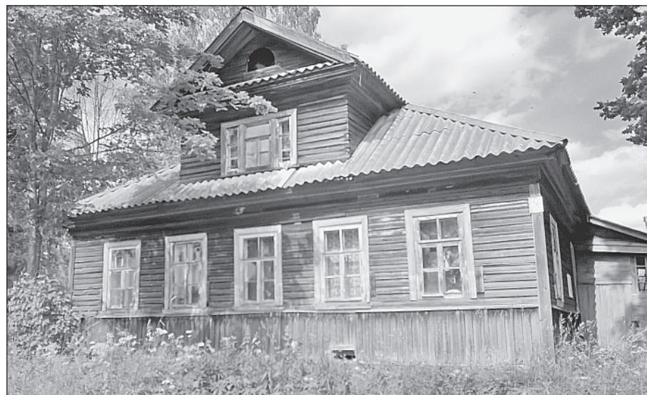
Этот дом в Млёве помнит великого Менделеева