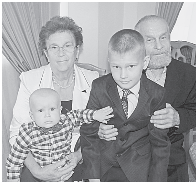
Супруги Коровины с внуками

Семейного благополучия желают им благочинный